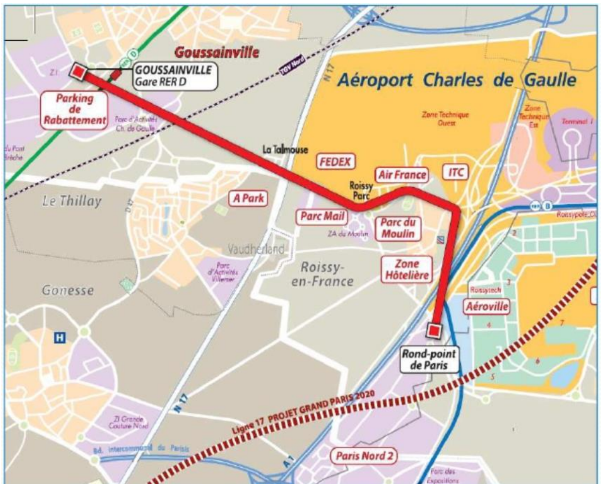
Carte du projet de Roissyphérique

( http://www.roissymail.com/2014/09/17/roissypherique-bientot-un-telepherique-entre-goussainville-et-cdg/ ).