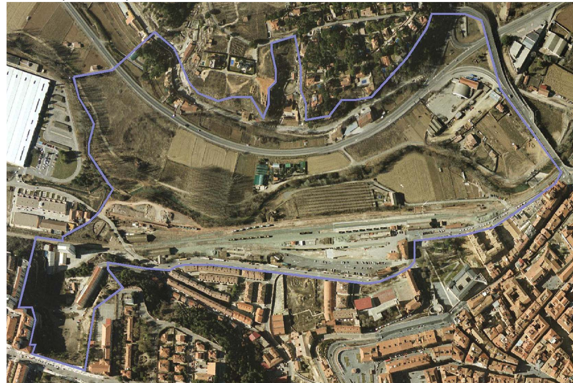
Teruel – España – europan 10