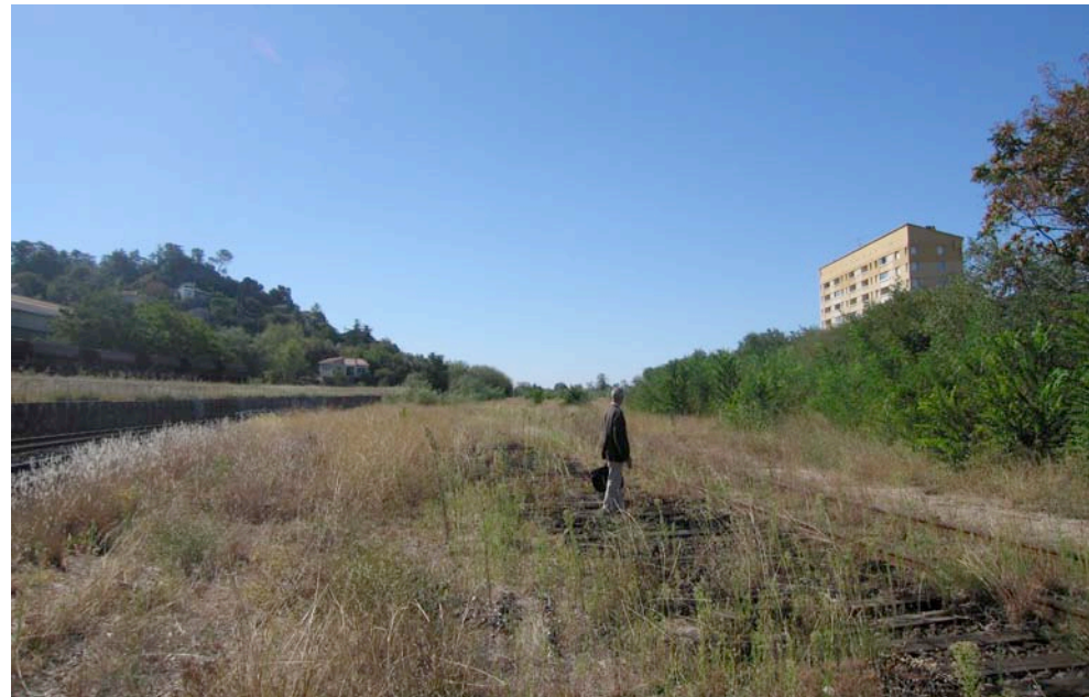
Vues des plateformes ferroviaires proches de la Gare