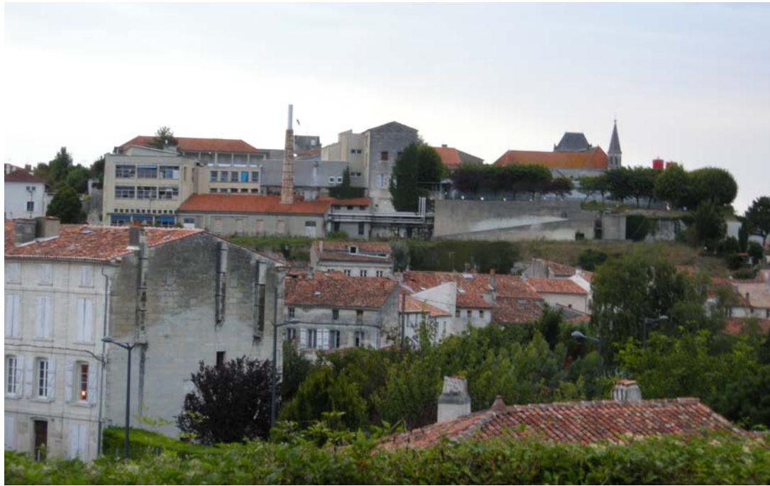
Façade Sud du site