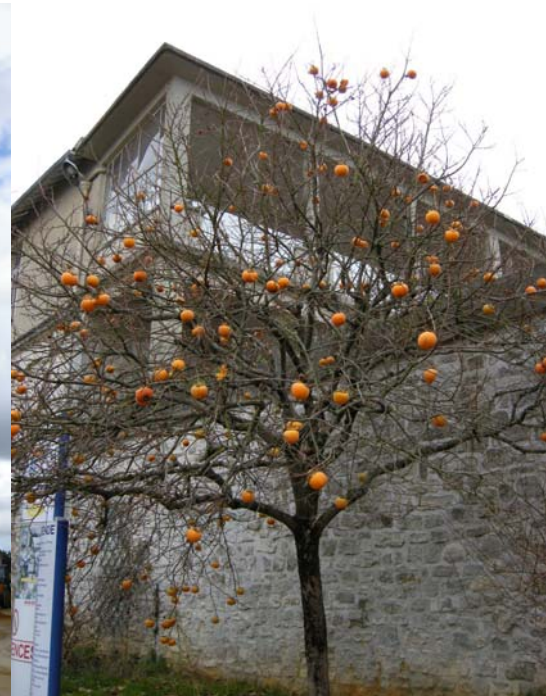
Bâtiment hospitalier avec extension