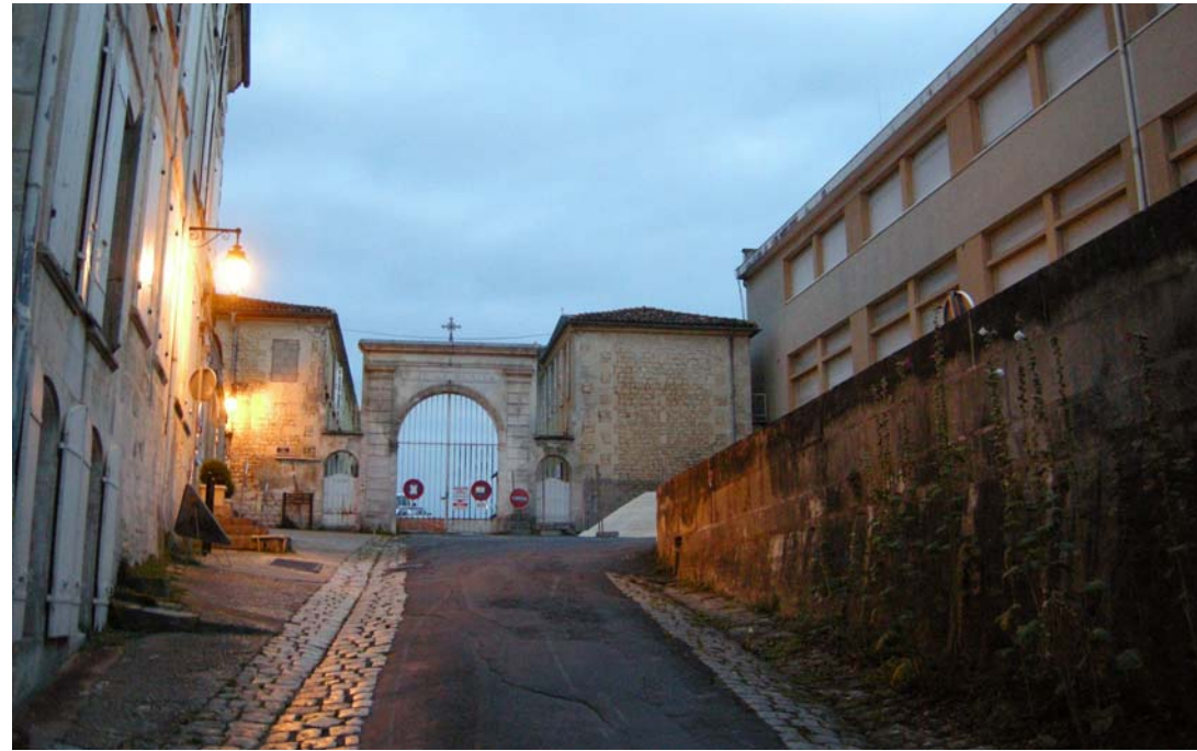
Accès historique du site