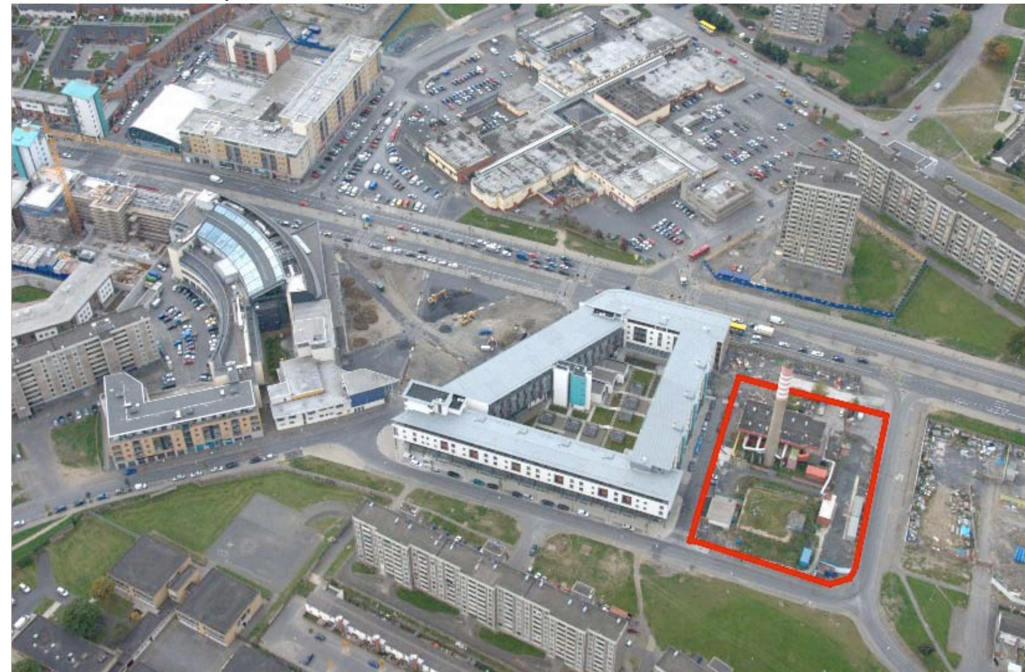
Luftbild des Boilerhouse-Geländes