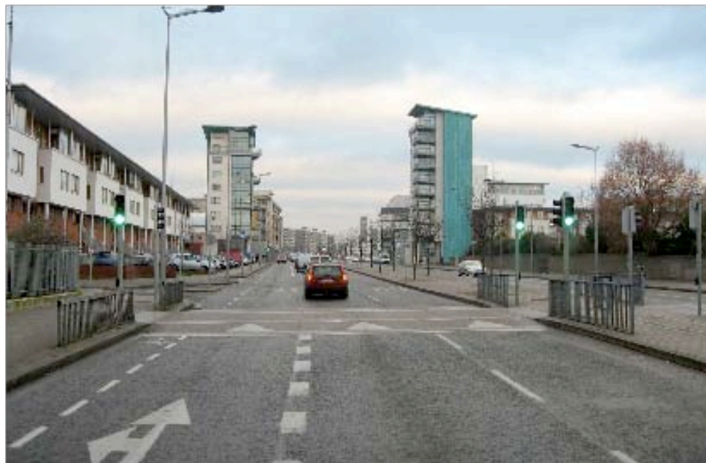
A Luftbild der Hauptstraße und des angrenzenden Gebietes B Straßenkreuzung angrenzendes Gebiet C Blick Richtung Süden auf das Betrachtungsgebiet D Blick Richtung Norden entlang der Ballymun Main Street