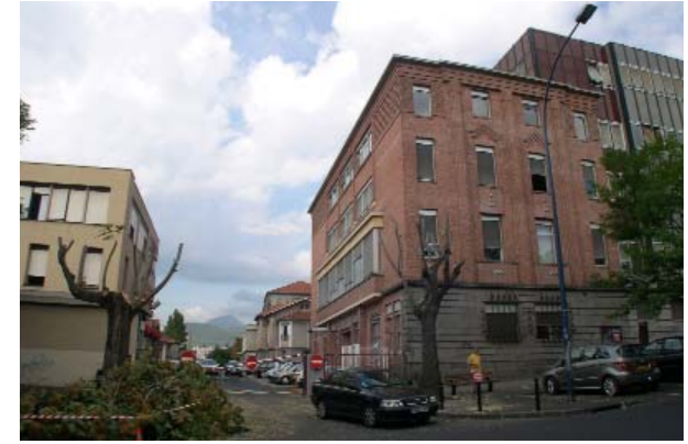
Maternité et laboratoire ou "pavillon Emile Roux"