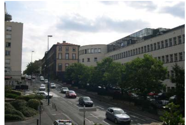
Bd Lagarlaye, Vue sur façade nord faculté dentaire