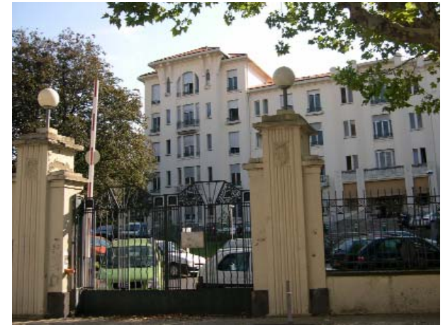
Portail d'entrée Bd Charles de Gaulle - Polyclinique