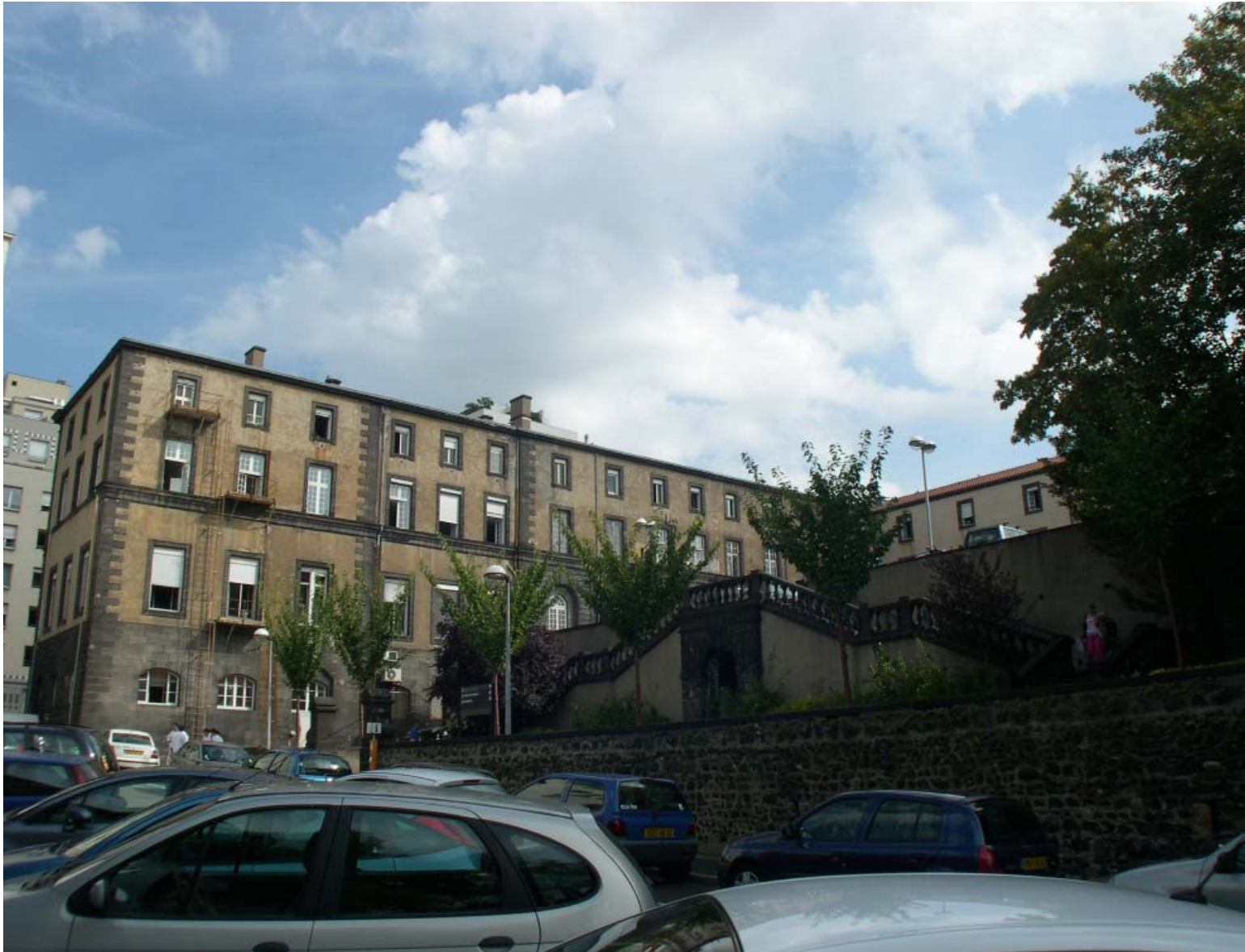
Vue sur l'escalier de la cour d'Honneur de la façade intérieure sud