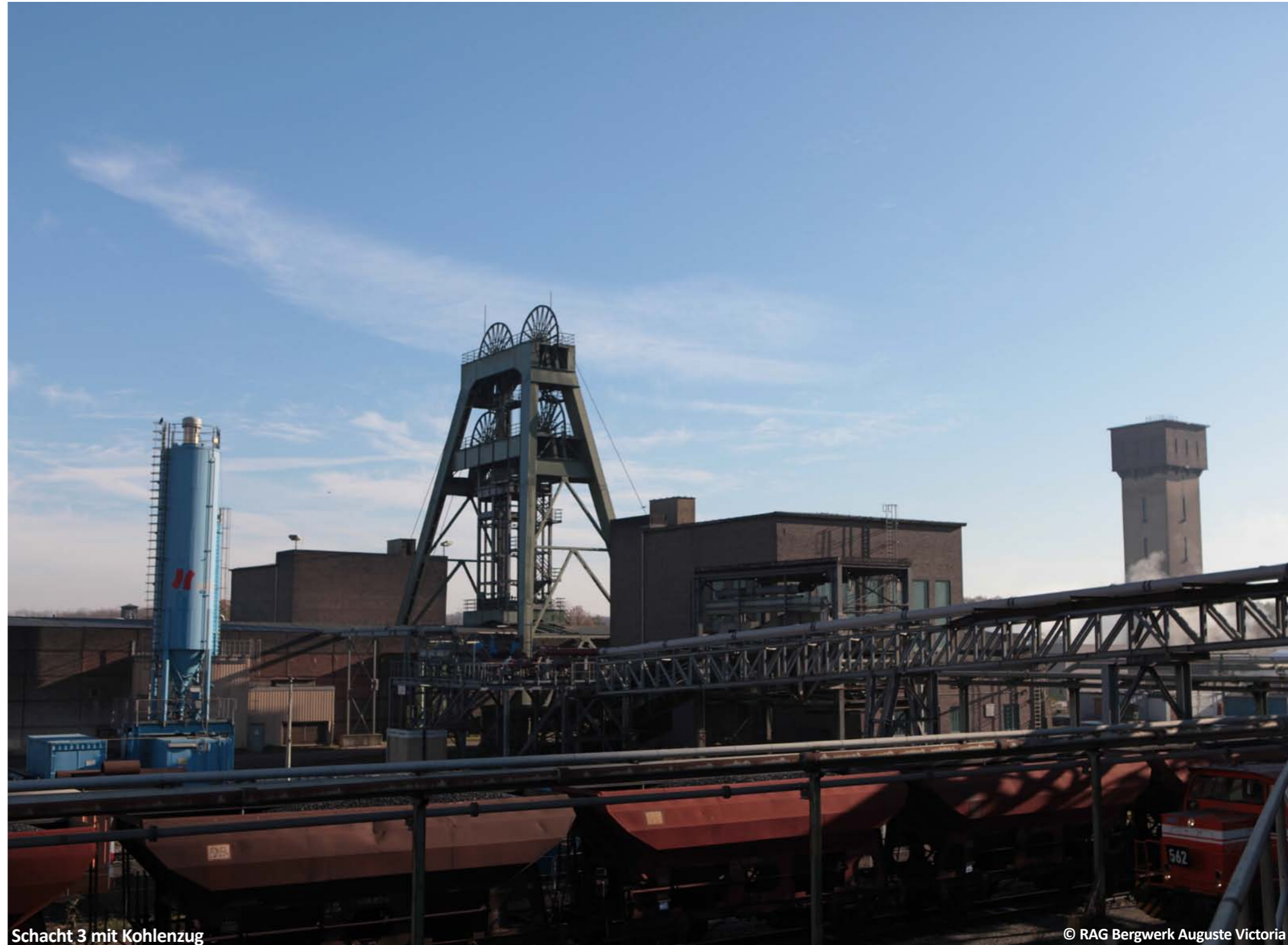
Schacht 3 mit Kohlenzug