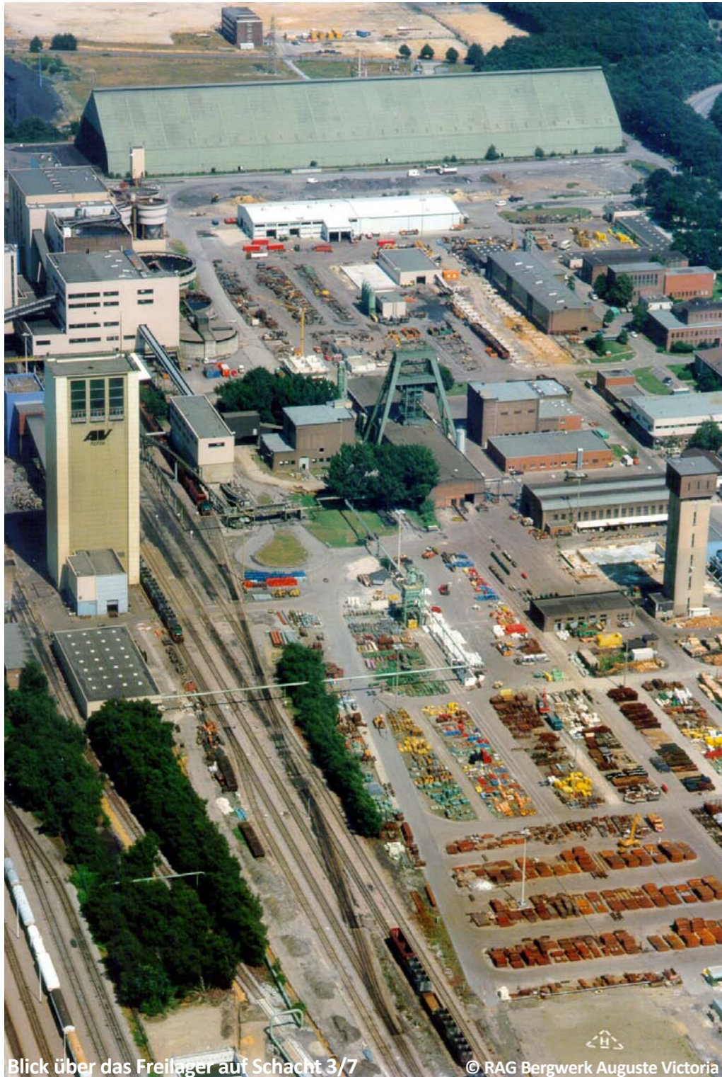
Blick über das Freilager auf Schacht 3/7