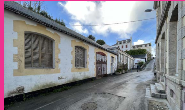
Réinvestir l'ancienne halle en marché