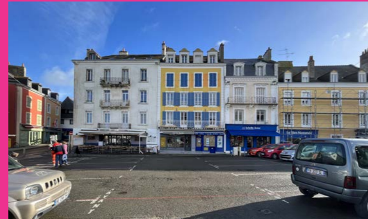
Nouvelles continuités du sol du port à celui du centre-ville