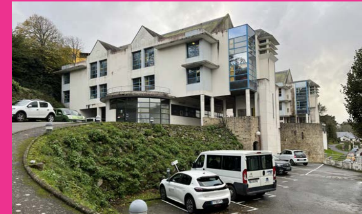
Transformer le site du foyer d'accueil médicalisé (FAM)