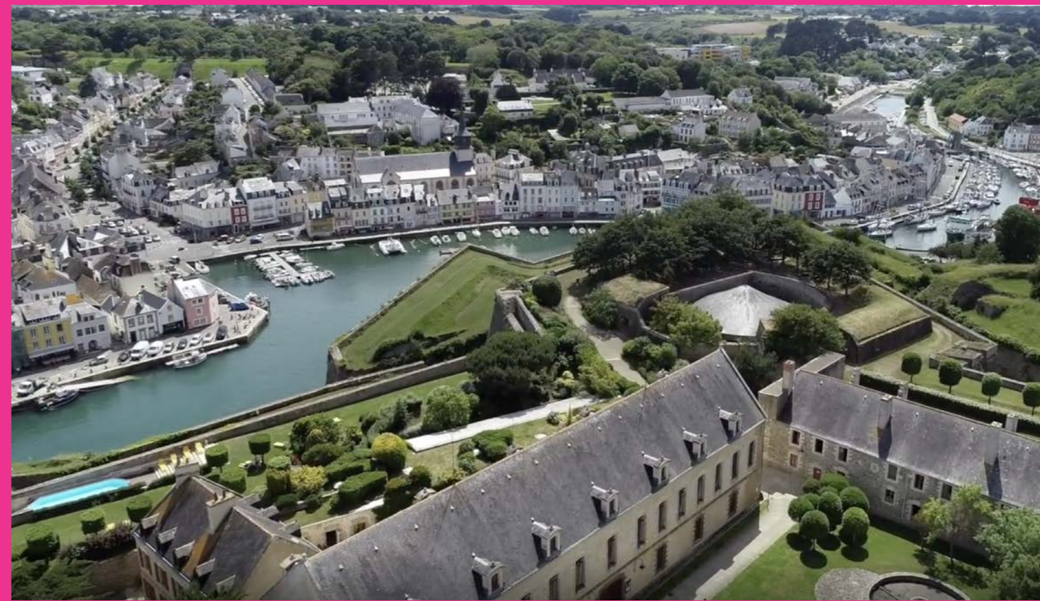
Penser la relation entre le port, la ville et Haute-Boulogne