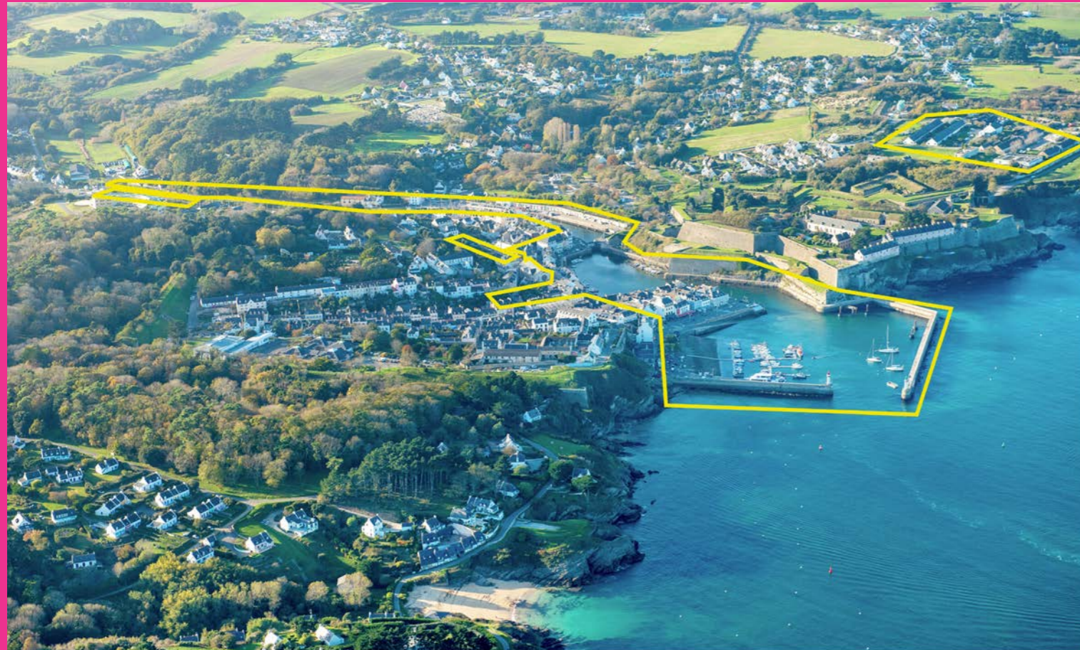
Deux périmètres : les espaces publics et port (dont Halle de marché et Foyer Accueil Médicalisé) et au nord l'ancien centre pénitentiaire.