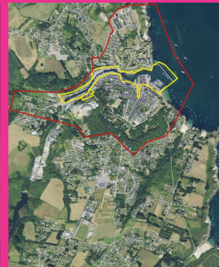
Site de réflexion : une vision élargie du centre-ville