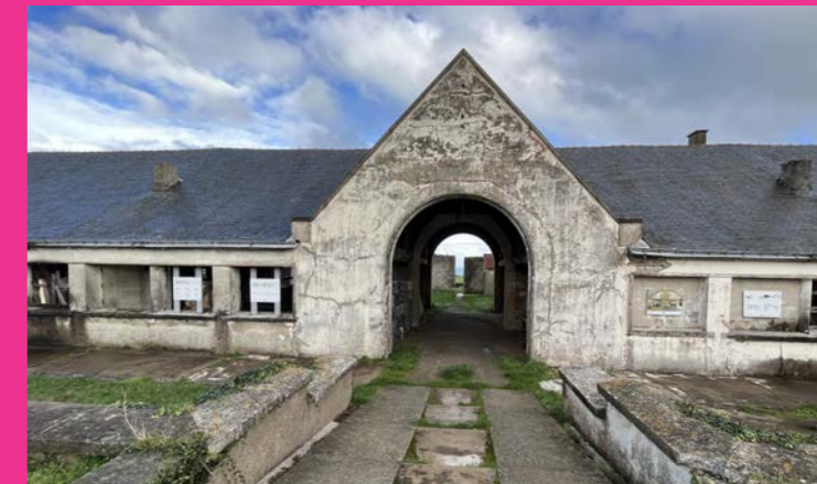
Penser le site de l'ancienne colonie pénitentiaire